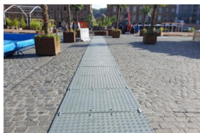
Mobi-deck, place Ducale à Charleville Mézières