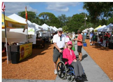
Mobi-deck, foire dans le New Jersey, USA