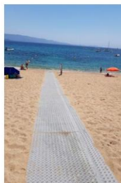
Mobi-deck sur la plage d'Ajaccio, Corse-du-Sud